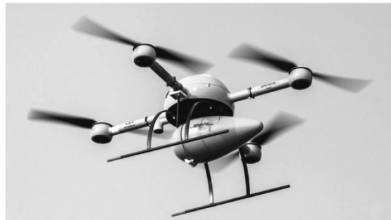
DHL's parcelcopter leaves for work

Amazon says that a drone-delivery service called Prime Air that it has tested in Canada will be ready by early 2015, assuming the FAA [Federal Aviation Administration] ban is lifted. Following recent testing in Australia, Google has also determined that deliveries with self-flying vehicles are practical, says Phil Swinsburg of Unmanned Systems Australia, a firm working on Project Wing, as the Google drone effort is known.